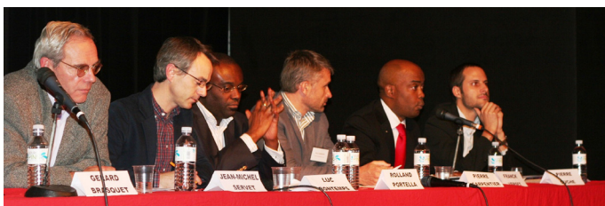
Table-ronde du gala Cofides, le 8 novembre 2012 à Paris

Pour la Cofides, il a également été l'occasion de resserrer ou de nouer des liens avec d'autres organismes de la diaspora africaine, à l'instar de la Cade (Coordination pour l'Afrique de Demain), de l'African Business Club et du Club Affaires Afrique. D'autres opportunités de renforcer notre réseau nous seront offertes en 2013, notamment lors de la deuxième édition de la Foire Africaine, où nous tiendrons un stand (voir agenda ci-dessous).