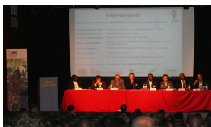
Retrouvez la vidéo du gala sur :

http://www.totemtv.net/actualite/viewvideo/1547