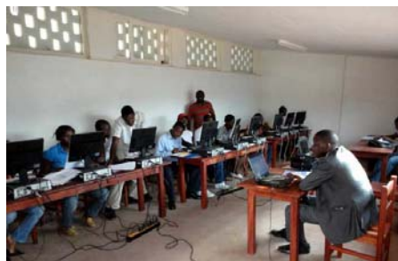
Les jeunes de la pépinière en formation

Banque partenaire : Crédit Communautaire d'Afrique (CCA) (IMF)