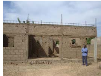
Boulangerie des frères Diallo Région de Kayes